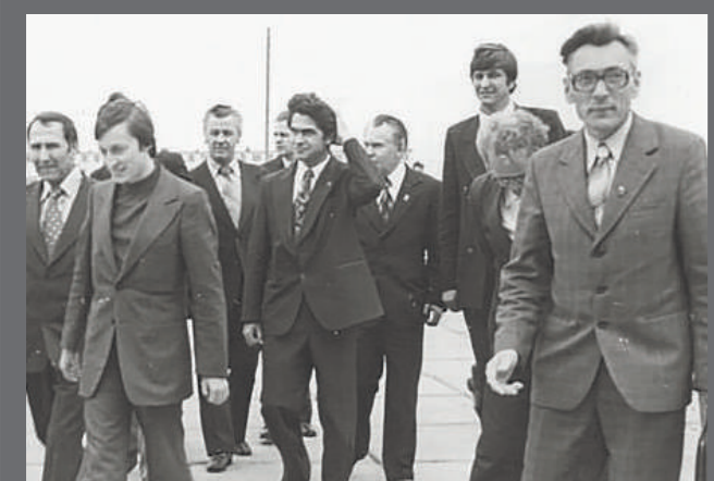
На встрече А. Карпова и космонавта В. Севастьянова с трудящимися ОЗТП